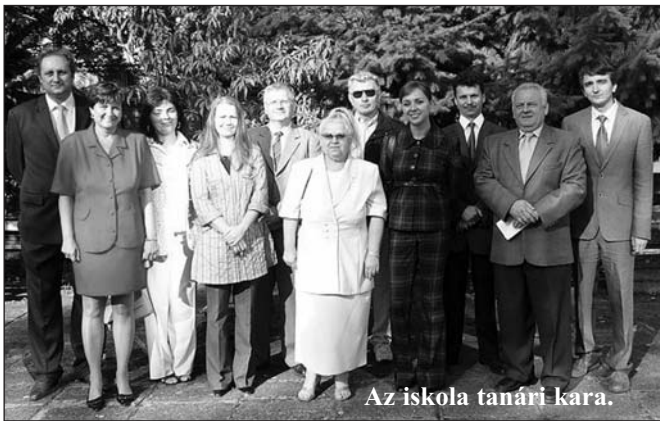
Az iskola tanári kara.